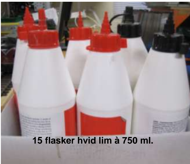
15 flasker hvid lim à 750 ml.

3 stk. 12 mm polsk fyr à 2440 x 1220 mm., samt div. skruer, stifter mv.