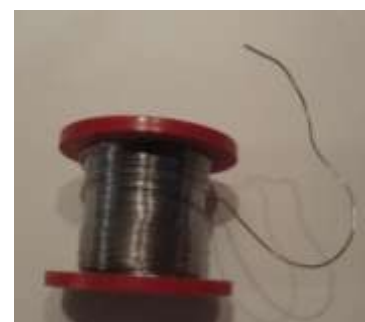
- og naturligvis loddetin

Endvidere skal der "plantes" langt græs, små buske for ikke at tale om materiale til baneskråninger mv. Der er heldigvis arbejde til mange hyggelige klubaftener endnu.