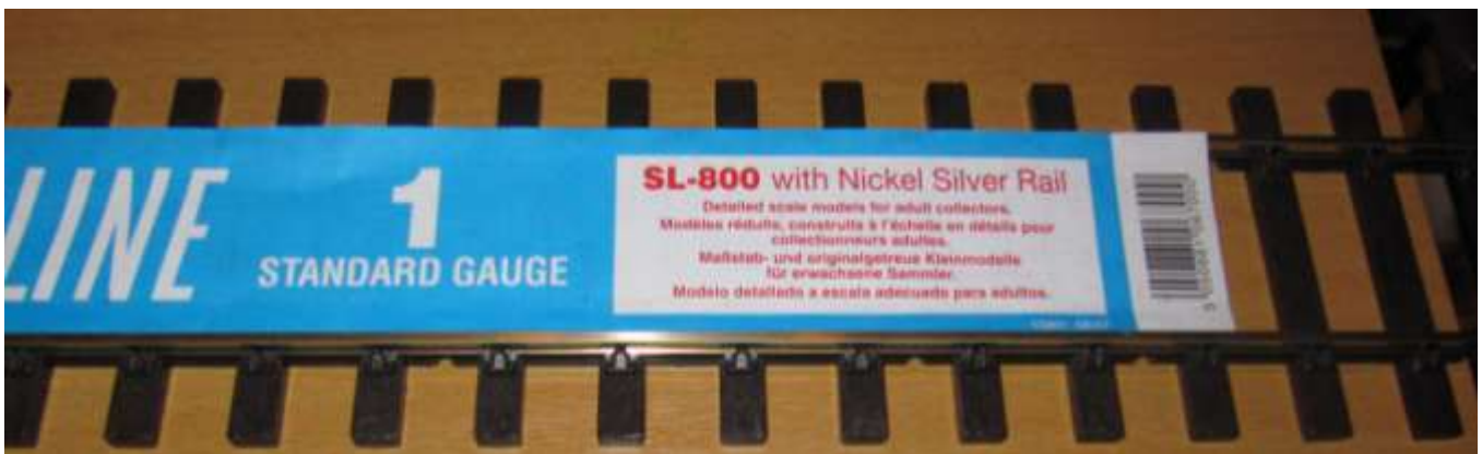
36 stk. PECO skinner