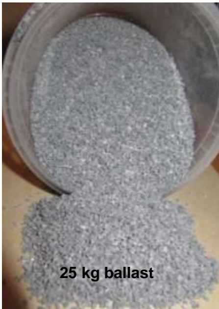
25 kg ballast