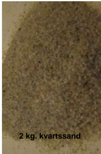
2 kg. kvartssand