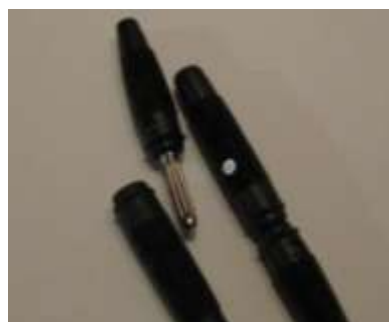
36 banastik m/sidehul og 36 banan hun sort Hirschmann