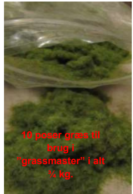
10 poser græs til brug i "grassmaster" i alt ¾ kg.