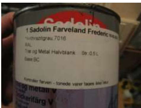
1½ liter atrazitgrå maling til modulsiderne.